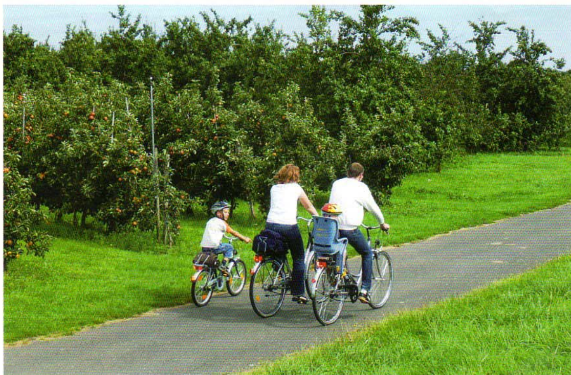
Einfach traumhaft für Fahrradfahrer und Obstliebhaber: Das Alte Land

bus wie im Fluge vergehen. Informationen zum Elbe-Radwanderbus sowie den Fahrplan gibt es unter www.elberadwanderbus.de oder beim Tourismusverband Landkreis Stade / Elbe e.V. unter 04142 / 8138-38.