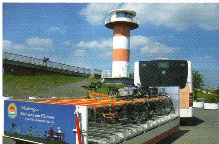
Der Elbe-Radwanderbus verkürzt die Anreise aus Harsefeld

Kurz vor Jork-Höhen trifft der apfelbaumgesäumte Wirtschaftsweg auf den Lühedeich, wo sich ein Abstecher zur nahegelegenen 'Hogendiekbrücke', einer im holländischen Stil erbauten Holzklappbrücke, lohnt. Über den Lühedeich führt der Weg zurück zum